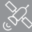
GPS-NAVIGATION UND - TRACKING