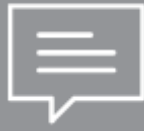
SENDEN UND EMPFANGEN VON SMS