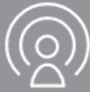
INTERAKTIVE SOS- NOTRUF

Garmin-Produkte mit inReach-Technologie ermöglichen es dir, auch in den entlegensten Gegenden immer in Kontakt zu bleiben. Alle inReach-Lösungen umfassen die folgenden grundlegenden Funktionen: